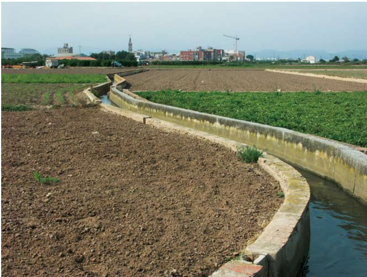
El braç de Dalt del brazo de Petra de la acequia de Mestalla y, al fondo, Carpesa. Se constata la adaptación del trazado a las curvas de nivel, en un ámbito que, además, fue marjal al menos hasta el siglo XIII

conjunto de brazos, files, rolls y regadoras que toman el agua de la acequia madre y la distribuyen por las parcelas para su uso. No todos son iguales en jerarquía y funciones y hay que establecer una clara diferencia entre ellos: los brazos representan las grandes particiones del sistema mientras que las filas y rolls suelen corresponder a tomas de menor entidad, mientras que las regadoras son los canales más sencillos que llevan el agua a cada parcela.