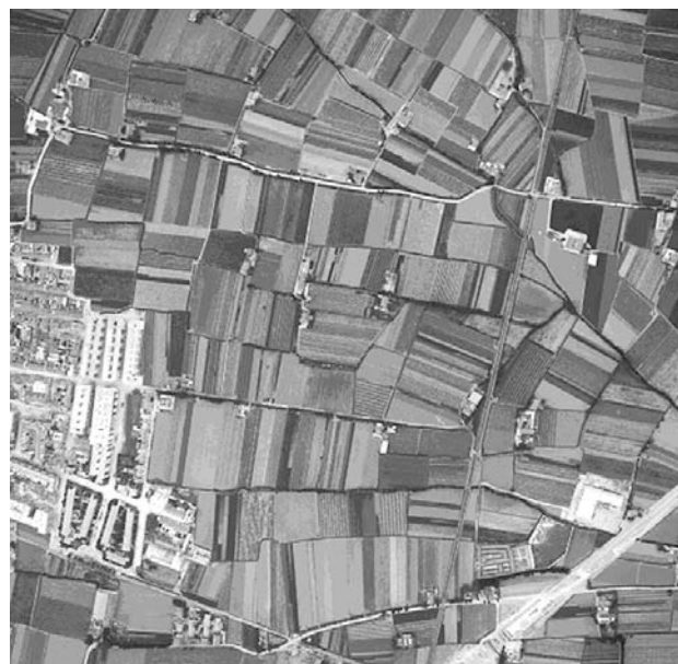
Estructura del parcelario en la huerta de Benimaçlet (1967). Obsérvense los ejes de las acequias y caminos de izquierda a derecha (V-E), irregulares a pesar de lo muy plano del terreno, y cómo las parcelas se ordenan perpendicularmente a ellos. En este caso se trata de medidas en fanecas mayoritariamente y son trazados muy rectos

Estamos hablando pues de una superficie que en su momento máximo de extensión a principios del siglo XX llegó a tener unas 13.200 Ha más otras 4.700 de antiguos marjales, lógicamente hoy reducidas aproximadamente a unos dos tercios de ellas a causa del crecimiento urbano, y repartidas entre 40 municipios. A ello cabe añadir por último la complejidad de su organización social a lo largo