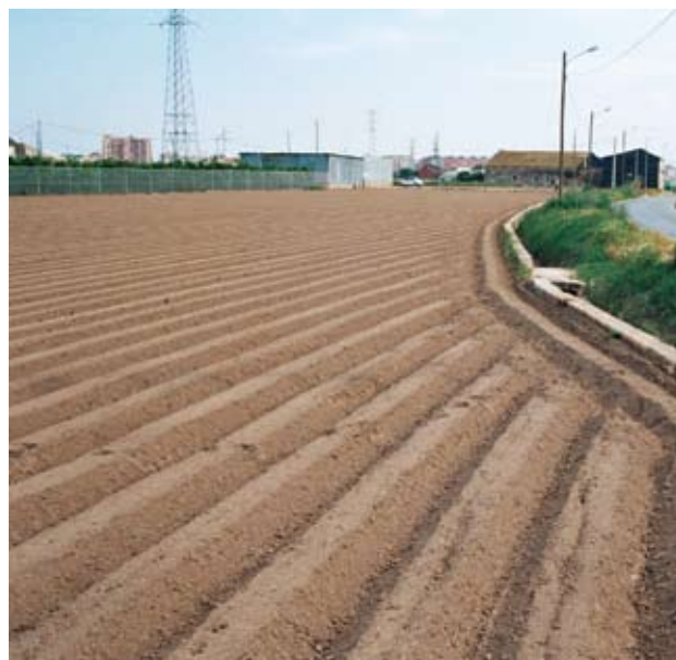
Adaptación de la parcela medida en hanegadas a la curva del camino de Carpesa, generando un límite exterior claramente irregular que dificulta la medición del campo. Razonablemente el camino era previo al repartimiento y medición feudal del siglo XIII y fue respetado como eje organizativo del paisaje

Es por ello que el asentamiento poblacional musulmán alrededor de la ciudad a partir del siglo VIII y su crecimiento progresivo hasta principios del siglo XIII estuvo íntimamente ligado a la construcción de los sucesivos sistemas hidráulicos de la Huerta,